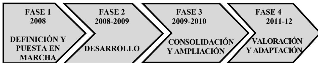
Cuadro 2. Fases del Plan de Educación Financiera 2008-2012

Fuente: Plan de Educación Financiera. 2008-2012.