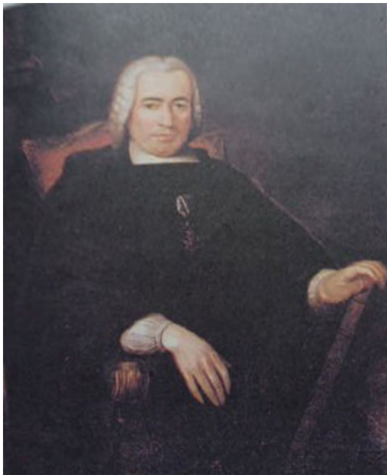
Fig. 7. Pedro Rodríguez Campomanes , por Vicente Arbiol, copiado de Joaquín Inza. Óleo sobre lienzo, 107x86 cm, 1841 (Real Instituto de Estudios Asturianos). La imagen procede del libro In Memoriam Pedro Rodríguez Campomanes , p. 673

hacia arriba, aunque no se ve por los tres dedos siguientes recogidos en ella), apunta al documento que Olavide, con quien parece estar hablando, sostiene en la mano, seguramente un documento relativo a las tierras de Sierra Morena dadas a los colonos. El gesto es más suave que el comentado anteriormente, aunque, sin lugar a dudas, sirve para señalar la importancia de los papeles.