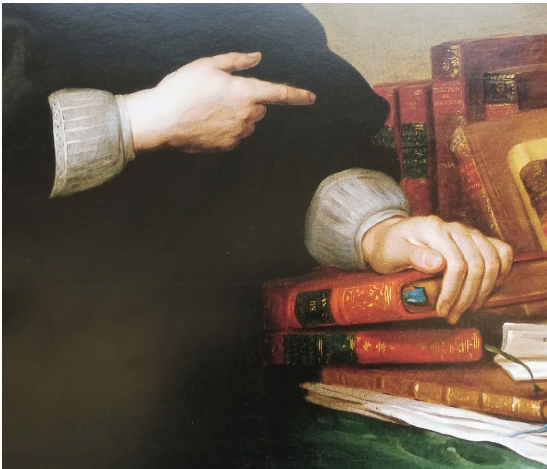
Fig. 6. El simbolismo de las manos . Primer plano del retrato de Campomanes, por Fco. Bayelmagen procedente del libro Campomanes y su tiempo

Este símbolo de direccionalidad, señalando los libros, aparece en el cuadro de Bayeu por primera vez (fig. 6), y en el de Carnicero (fig. 3), pero menos potenciado, mientras la mano izquierda apoya sus cinco dedos sobre un libro