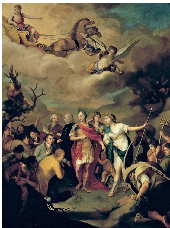
Fig. 1. Carlos III entregando las tierras a los colonos de Sierra Morena , por Alonso del Rivero, 1805. Óleo sobre lienzo, 168 x 126 cm, Primer premio, primera clase, 1805. N° de inventario: 0254. Museo de la Real Academia de Bellas Artes de San Fernando, Madrid

Estos cinco cuadros presentan a Campomanes revestido con el traje propio de un representante de la Justicia, en distintas posturas: de pie, de tres cuartos y sentado; con el rostro casi de frente o ligeramente escorzado; como único protagonista y en un espacio interior (a excepción de Alonso del Rivero, que lo representa en un retrato de grupo, al aire libre y con Campomanes de perfil). Se trata en los cinco lienzos de un retrato oficial de Campomanes, aunque algunos añaden para sí otras significaciones en cuanto a la finalidad por la que fueron ejecutados: el de Carnicero es un cuadro de agradecimiento de la iglesia de Tudela por los favores concedidos; el de Arbiol, de reconocimiento en su tierra natal, está dedicado a las Sociedades Económicas de Amigos del País, que ayudó a crear Campomanes; el de Galván, de representación oficial en la Galería del Senado, y el de Alonso del Rivero, un cuadro conmemorativo de un hecho histórico. El estudio se inicia con la presentación de este último cuadro, que rompe el prototipo del conjunto, al ser, como se ha señalado, un retrato de grupo, al aire libre, con la particularidad de ser el único que refleja el perfil de Campomanes.