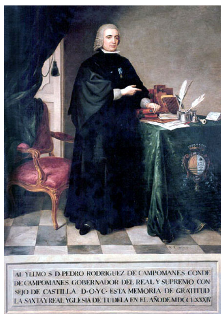
Fig. 3. Pedro Rodríguez de Campomanaes . Retrato de Antonio Carnicero, 1784. Óleo sobre lienzo, 230 x 115 cm, Catedral de Tudela (Navarra). Imagen del dominio público (internet)

De los cinco retratos investigados, es Carnicero (1748-1814), el primer pintor que deja asomar con claridad, debajo de la larga toga negra de Campomanes, la punta redondeada de uno de sus zapatos negros: el zapato de hebilla correspondiente al pie derecho, donde brilla, a través de una ligera pincelada blanca, el reflejo metálico de la hebilla rectangular, que no se ve completa, sino solo en su parte superior (más tarde, en 1805, del Rivero permitirá ver la punta del zapato de Campomanes, apenas perceptible).