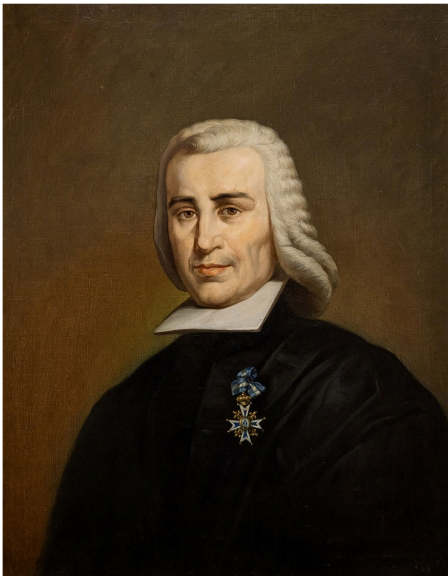
Fig. 4. Pedro Rodríguez Campomanes , por José María Galván y Candela. Óleo sobre lienzo, 80 x 63 cm. Imagen procedente del libro El Arte en el Senado , 1999

En todos los cuadros, aparece Campomanes con una condecoración con la que siempre quiso retratarse. Se sitúa sobre su pecho izquierdo, y donde mejor se aprecia, por su tamaño y esmero en la representación, hasta mostrar los detalles, es, en primer lugar, en el lienzo de Galván (fig. 4).