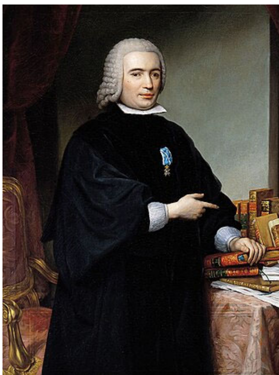
Fig. 2. Pedro Rodríguez de Campomanes , por Francisco Bayeu (copiado de A.R. Mengs), 1777. Óleo sobre lienzo, 78 x 55 cm, Real Academia de la Historia

El cuadro de Mengs se extravió o acabó destruido u ocultado. Solo queda la copia realizada por Francisco Bayeu (1734-1795), de la que se da, a continuación, una breve descripción.